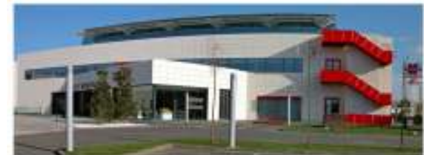
Sede Agoncillo (Logroño)