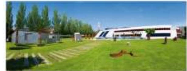
Sede Palau-solità i Plegamans (Barcelona)