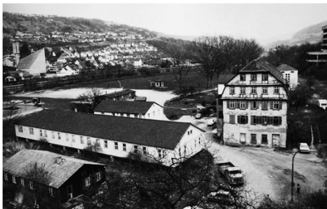
Sociedad mercantil mayorista de tornillos y tuercas fundada en 1945 en Künzelsau