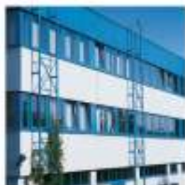
Fabricantes de ventanas