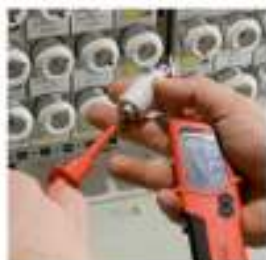
Electricidad y Sanitarios