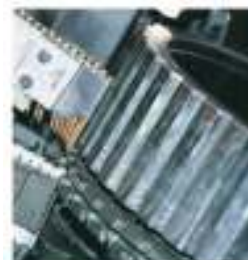
Fabricantes de maquinaria