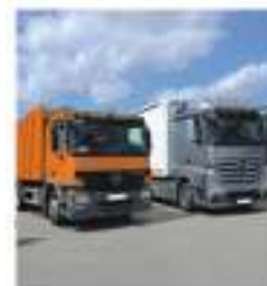
V.I. y Maq. Agrícola