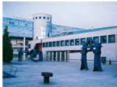
Sede central Würth en Künzelsau (Alemania)